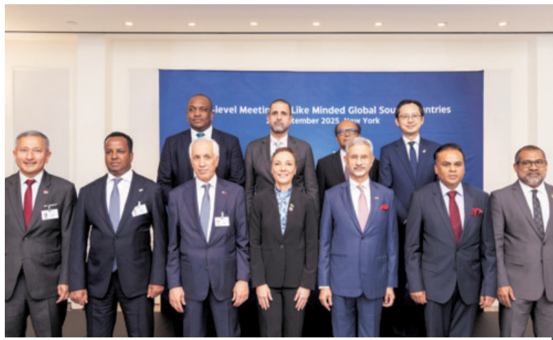
External Affairs Minister S Jaishankar (front row, third from right) poses at the High-Level Meeting of Like Minded Global South Countries on the sidelines of the United Nations General Assembly session in New York, USA.

Jaishankar sought unity among the countries of the Global South to work on creating a stable environment for balanced and sustainable economic interactions, including more South-South trade, investment, and technology collaborations and fair and transparent economic practices that democratise production and enhance